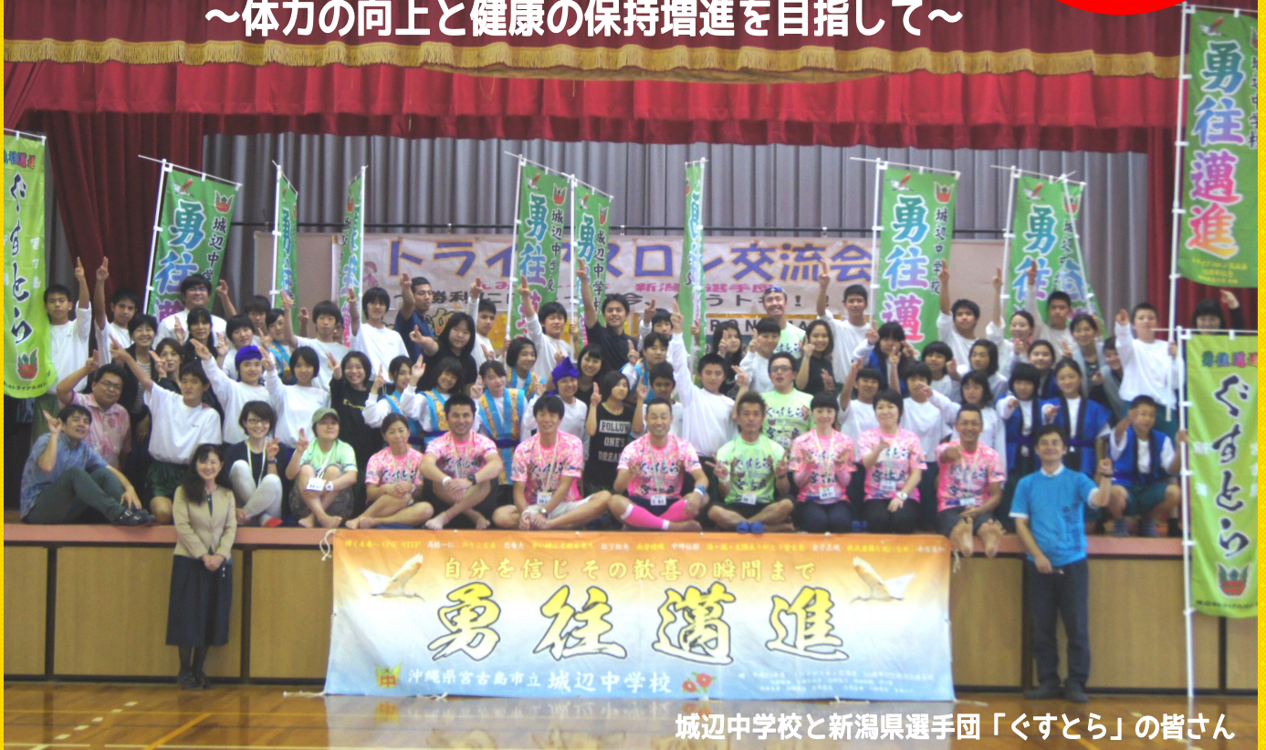
城辺中学校と新潟県選手団「ぐすとら」の皆さん